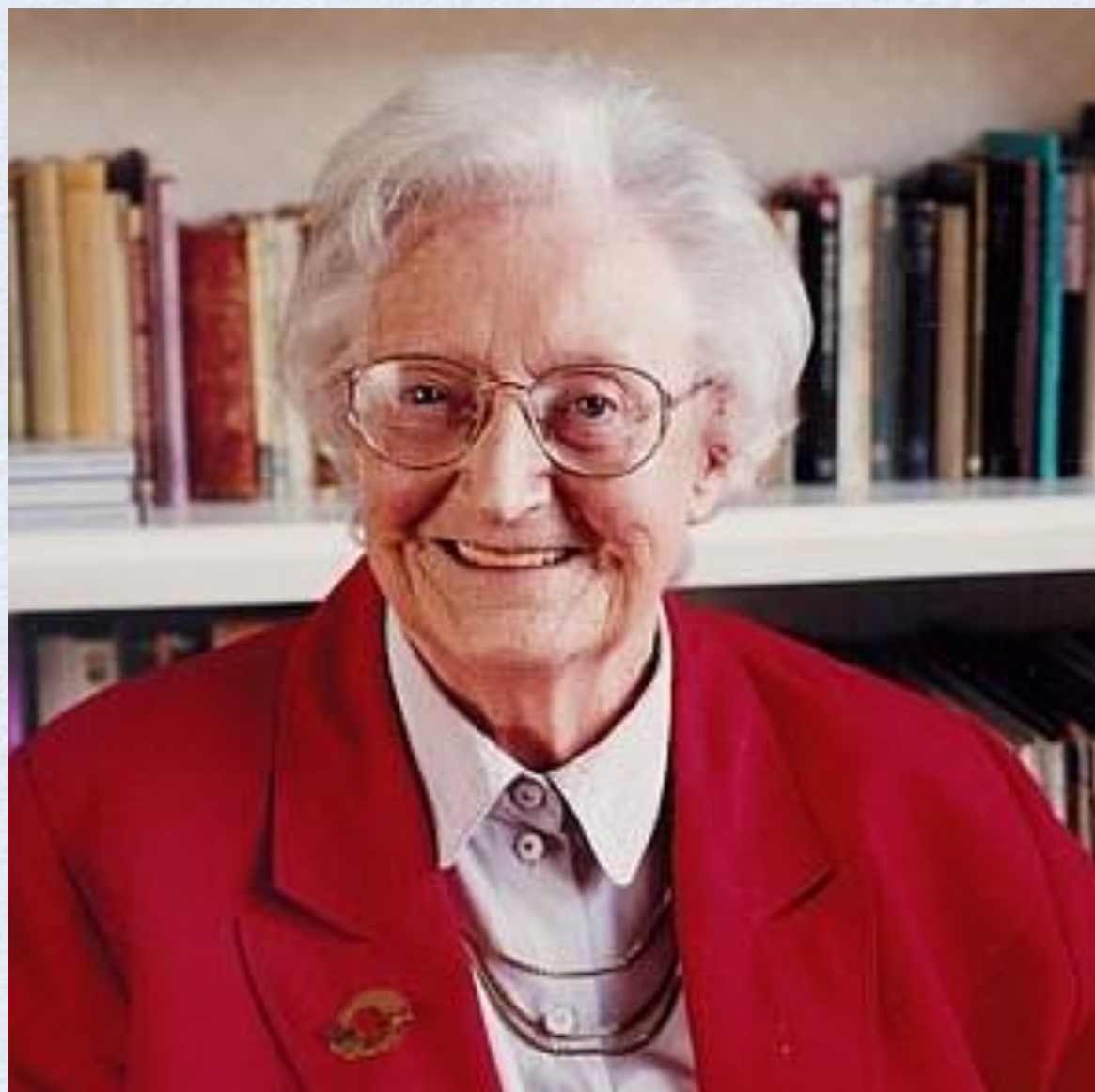
Cecily Saunders infermiera assistente sociale medico